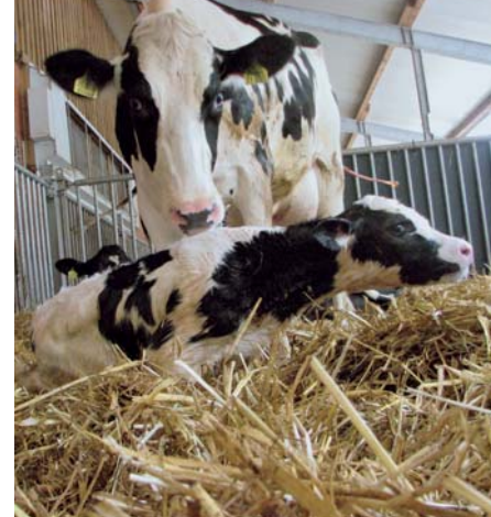
Einsatz von Glycerin zur Ketoseprophylaxe scheint eine Alternative zum Propylenglykolzusatz zu sein.

54 Kühe und Färsen wurden ca. 1 Woche vor dem errechneten Kalbetermin in verschiedene Abkalboxen überführt, in denen sie entweder die Ration mit Propylenglykol oder